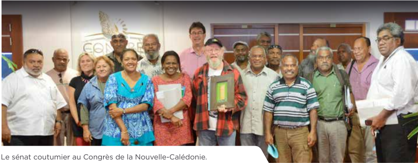
Le sénat coutumier au Congrès de la Nouvelle-Calédonie.

Le sénat coutumier est compétent pour être force de proposition concernant les sujets relatifs à l'identité Kanak. Le 12 octobre dernier, une commission plénière du Congrès était dédiée à la présentation par le sénat de trois propositions de textes sur lesquels il travaille depuis de nombreuses années.