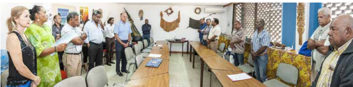
Visite de l'aire Drubea-Kapumè.

Dès le début de cette mandature, une délégation composée d'élus du Congrès a rendu visite à des institutions de la Nouvelle-Calédonie. Ces dernières semaines, elle a poursuivi sa tournée sur les aires coutumières de la Grande Terre ainsi qu'au gouvernement.